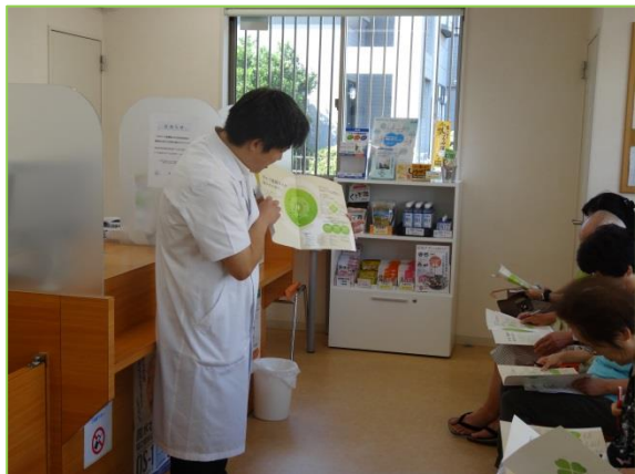
薬局長の挨拶と薬局の紹介です。