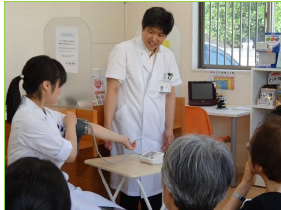
血圧測定のデモ を行いました。