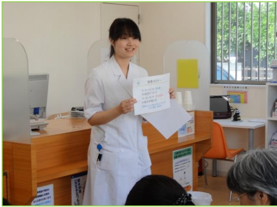
薬剤師の 血圧についての講義 です。