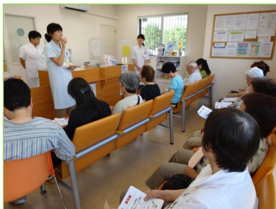
管理栄養士の 塩分の摂り方の講義 です。