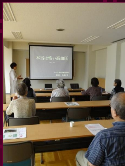
薬剤師、管理栄養士の講義 から始まりました。