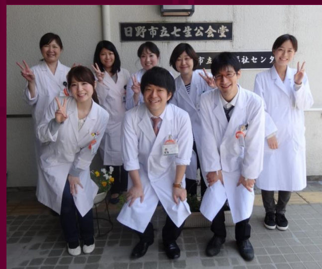
ご参加ありがとうございました！！