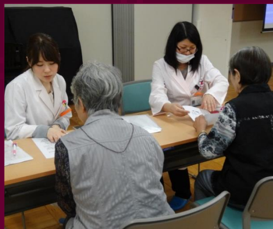
BMIの算出と腹囲測定を行いました。