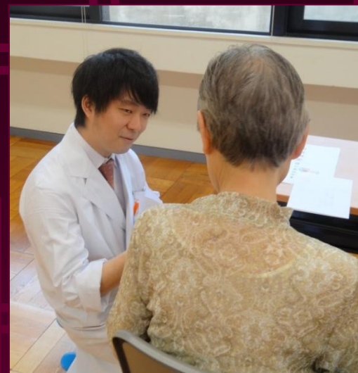
血流測定と血圧測定を行いました。皆様、緊張気味です！！