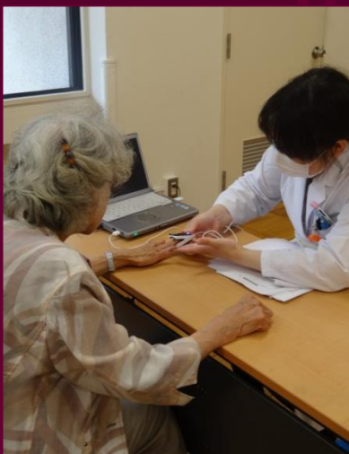
血管年齢を測定しています。