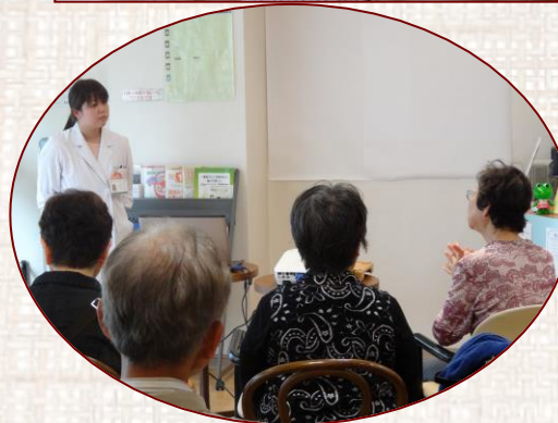
質問が飛び交いました。