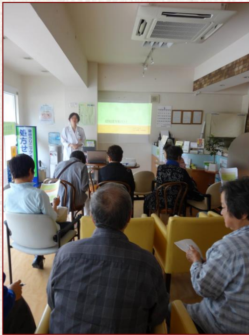
薬局長より挨拶。認知症について学びました。